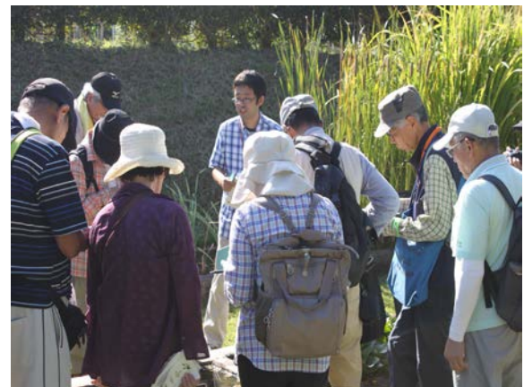
昨年度の「水生植物観察会」の風景