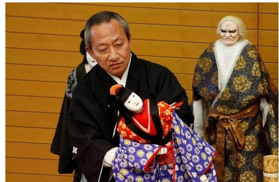
昨年の人形レクチャーの様子（『奥州安達原』）