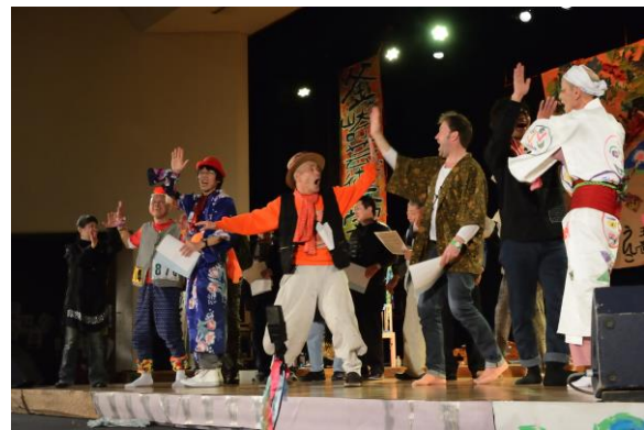
「釜ヶ崎オ!ペラ(2014年)」の様子

本プログラムの特徴である社会包摂型アートマネジメントとは、被災地や貧困地域、病院や障害者施設といった、問題を抱えたり社会から遠ざけられたりしている地域や施設において、アートを通して解決の道筋や回復の手立てを見出していくものです。