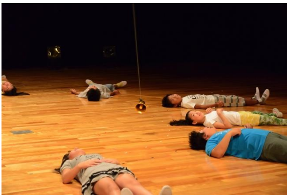
「こども熱帯音楽祭(2015年)」の様子

大阪市立大学文学部は、平成28年6月から平成29年3月にかけて、社会包摂型アートマネジメント・プロフェッショナル育成事業：「アートの活用形?」を実施します。この人材育成事業は、文化庁による「大学を活用した文化芸術推進事業」に一昨年度より3年連続で採択されたもので、アートマネジメントの専門家を養成するユニークなプログラムです。